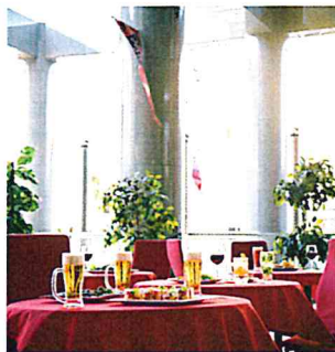
オープンエリアイメージ

今年(2020年)は予約なしで気軽にご利用頂けるチケット制と、3日前の予約で4名さまからご利用頂ける「ビアプラン」をご用意。「ビアプラン」はビールに合うお料理5品に2時間飲み放題!また、「ビアプラン」をご利用のお客さまとチケット6枚綴をお買い求めのお客様には「すすきの天然温泉湯香郷」をお1人様1回限り1,000円+税でご利用頂ける「温泉優待券」をプレゼント!