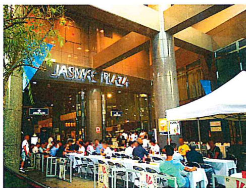
オープンエリアイメージ(過去開催)