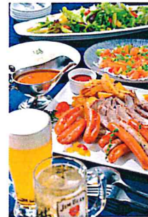
フード・ドリンクイメージ